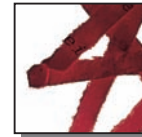
Coupe croisée 4x40 mm Niveau de sécurité DIN 3 Documents confidentiels.