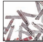
Coupe croisée 2x15 mm Niveau de sécurité DIN 4 Documents confidentiels ou secrets.